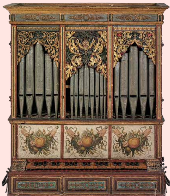
Gehäuse eines Orgelpositivs, Ende 17. Jahrhundert

Das gewählte Repertoire sollte sich am Thema „vokale und instrumentale Monodie“ orientieren und ist darüber hinaus frei wählbar. Die Vorschläge werden am 23. Januar 2025 abends bei der Einteilung der Workshops mit den Dozentinnen besprochen und in der Aufteilung berücksichtigt. Nach Maßgabe der Möglichkeiten kann auch Unterricht bei beiden Dozentinnen gewählt werden.