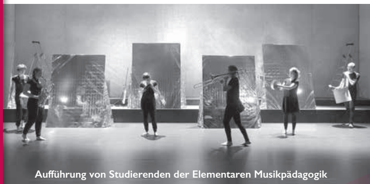
Aufführung von Studierenden der Elementaren Musikpädagogik