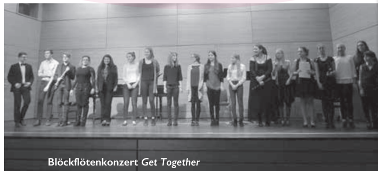
Blockflötenkonzert Get Together