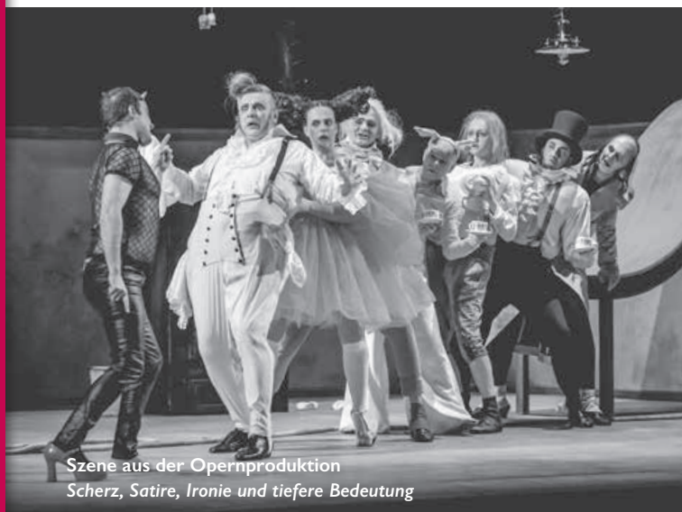
Szene aus der Opernproduktion Scherz, Satire, Ironie und tiefere Bedeutung