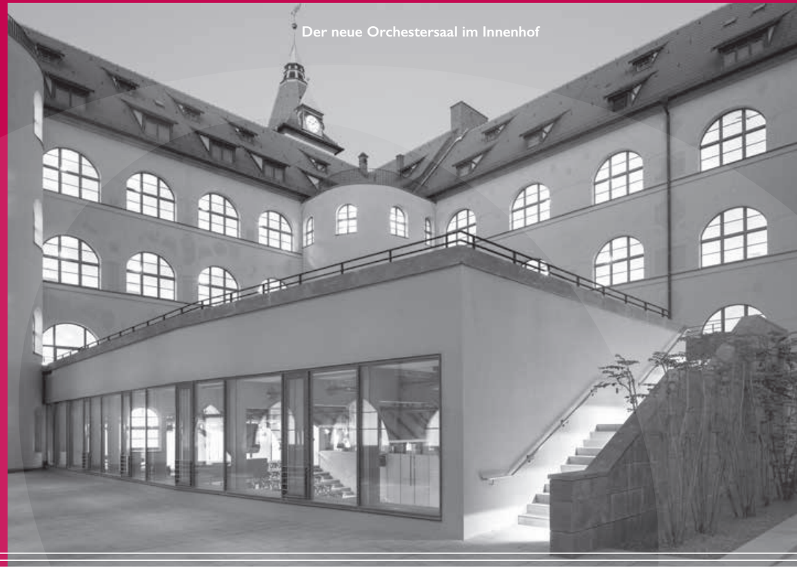
Der neue Orchestersaal im Innenhof