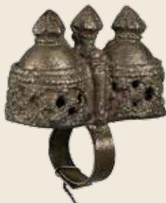
Titel: Kastagnettenpaar, Spanien, 19. Jahrhundert. GNM, Slg. Rück Oben: Rollschelle, wohl Türkei. GNM, Slg. Rück, Germanisches Nationalmuseum, Foto: Günther Kühnel

Alle aktiv Teilnehmenden erhalten je eine Unterrichtseinheit bei Michael Metzler und Philip Tarr. Alle Workshops und Meisterklassen finden als open classes statt. Weitergehende Informationen unter www.hfm-nuernberg.de/veranstaltungen/forum-schlaginstrumente Allgemeine Informationen erhalten Sie von Dr. Miriam Noa unter m.noa@gnm.de .